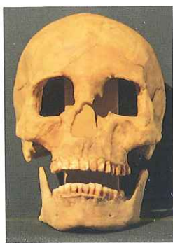
Lebka české královny Judity.

ních Teplic. Keltské mince s vyobrazením kance a koně svědčí o užívání léčivých pramenů. Obětovat bohům vod dokládají i nálezy římských mincí z počátku letopočtu, kdy místem procházely karavany kupců po pradávné cestě k horám a putování neustávala ani v čase bojů germánských kmenů. V době stěhování národů, kdy přišli do české kotliny Slované, se na Teplickou a Duchcovsku usadili Lemuzi, snad to bylo v 8. století. Lemuzské území bylo připojeno k přemyslovskému knížectví ke konci 9. století. Hradiště v Bílině, v Chlumci a Zabrušanech chránily tuto pohraniční oblast a důležité obchodní stezky přes Krušné hory (solná nebo srbská). Na území města bylo více osad, z nichž jedna již nesla jméno Teplice. První písemná zmínka týkající se Teplicka je z roku 1057. Na