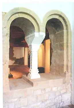
Pohled do románské kapitulní síně.

sitského přivřezence přijaly benediktýnky „čtyři artikule“. V českých Teplících bylo přivřezenců husitství mnohem více, než v okolních městech. Město ani klášter neutrpěly roku 1426, kdy šiky táboritů procházely Teplícemi k Ústí. Klášter však vyplenilo vojsko Míšňanů. Řeholnice se uchýlily na hrad Střekov a roku 1435 do mateřského kláštera sv. Jiří v Praze. Teplickou ovládl vojenskými i diplomatickými schopnostmi obdařený husitský hejtman Jakoubek z Vřesovic. Po jeho smrti (asi roku 1462) připadlo teplické panství opět královské koruně a král Jiří z Poděbrad je dal připsat své choti královně Johance z Rožmitálu. Jejímu správci Janu Ilburku z Vřesovic dal právo vystavět na Doubravské hoře hrad.