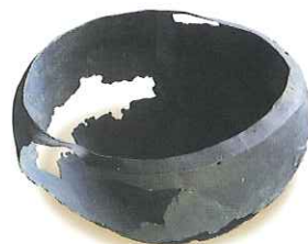
Bronzový kotlík ukrýval poklad Keltů v Obřím prameni.

ra benediktýnek v letech 1158 až 1164. Na ostrožně, pod níž vytékaly teplé prameny, byly postaveny kamenné budovy ženského kláštera a bazilika zasvěcená sv. Janu Křtiteli, kde první česká královna našla nepochybně místo posledního spočinutí na dobu osmí set let. Ve století 13. se rozrůstala tržní osada v město směrem na západ a sever ve tvaru obdélníku. Osídlení napomohl příliv německých kolonistů. Město mělo právo mílové, trhu na sv. Jana a právo várečné. Spravovalo ho 12 konšelů, každý z nich sloužil jeden měsíc jako purkmistr; soudní moc vykonával rychtář. Město bylo domovem Čechů, Němců a asi od 14. st. Židů. Pomístní jména měla i ve středověku českou podobu. Význam pojmu „lázně u sv. Jana“ rostl. Snad vlivem oltářníka Jana z Třebenic, hu-