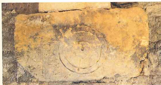
Detail z kapitulní síně teplického kláštera