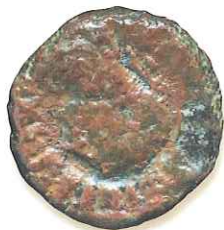
Jedna z římských mincí, které byly nalezeny roku 1879 v Pravičdle.

P ohled na město Teplice, ležící v širokém údolí pod Českým středohořím, se otevře poutníku sestupujícímu od severu z hradby Krušných hor. Název Teplice, odvozený od „teplý“, dalí místu s hojným výskytem teplých pramenů obyvatelé slovanského původu, kteří krajinu osídlili postupně od úrodného povodí řeky Bíliny v 6.- 8. století. K slovanskému osídlení se váže také pověst o objevení prame-